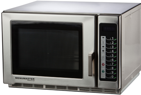
Se muestra Modelo MFS12TS