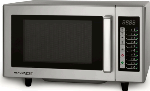
Se muestra modelo MMS10TS