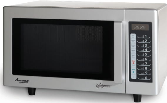
Se muestran modelos RMS10T y RMS10TS