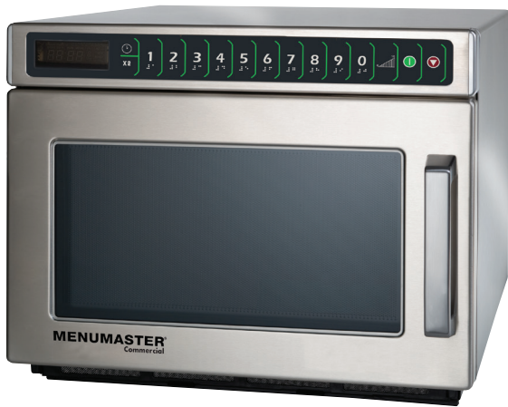
Se muestra modelo MDC12A2